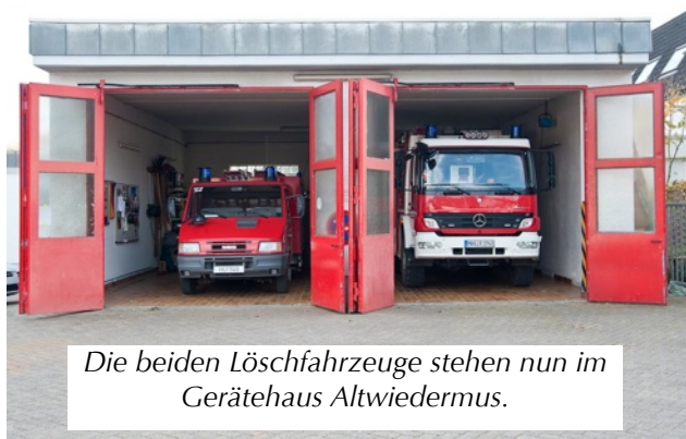
Die beiden Löschfahrzeuge stehen nun im Gerätehaus Altwiedermus.

Einsatzfälle werden immer beide alarmiert), wird insbesondere tagsüber eine zum Ausrücken notwendige Mannschaftsstärke so auch schneller erreicht, als wenn an zwei Standorten gewartet wird. Außerdem müssen die etwas später kommenden nicht mehr mit Privat-