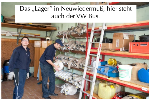
Das „Lager“ in Neuwiedermuß, hier steht auch der VW Bus.